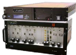
AVIO-601 Émulateur de canal RT Logic T400CS Channel Emulator