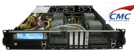
AVIO-601 Émulateur satellite BEECube BEE4 SDR